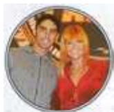
IN TV Eccolo al reality "L'isola dei Famosi".

Caro Filippo, firmare autografi ti fa piacere o ti disturba? «Fa sempre piacere essere apprezzati e amati per quello che si fa. E poi quest'anno con i Mondiali in casa abbiamo bisogno che gli italiani ci sostengano».