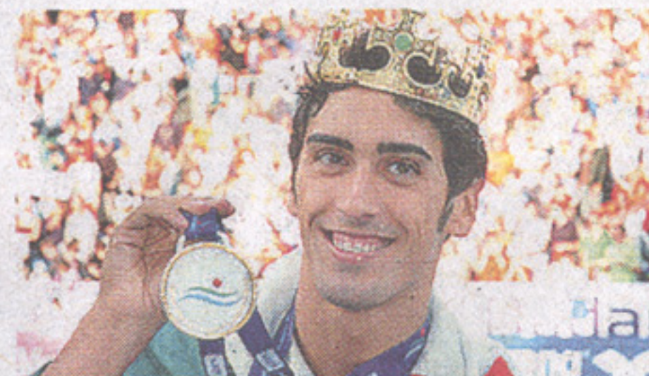
2006 Campione europeo dei 100 s.l.