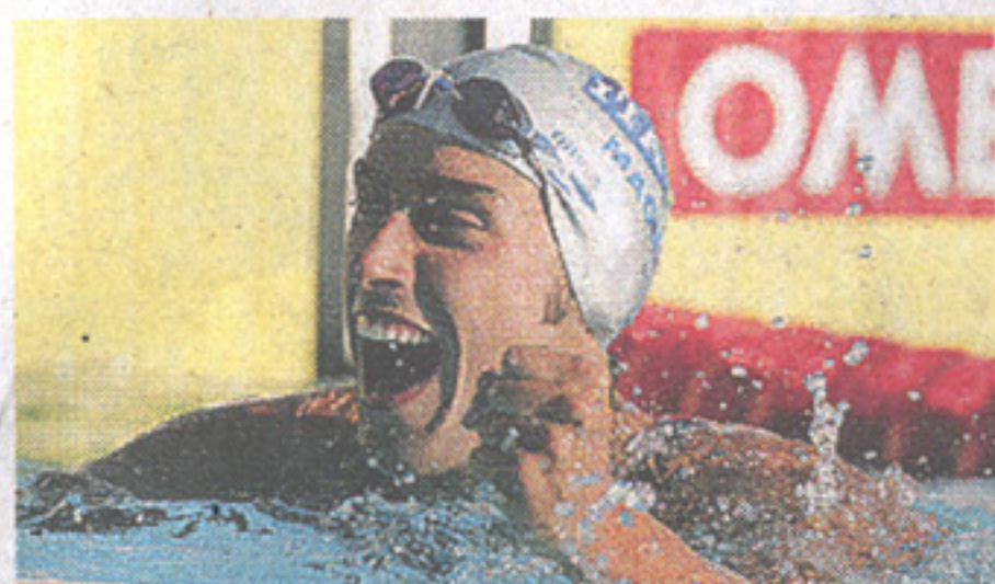
2005 Campione mondiale dei 100 s.l.