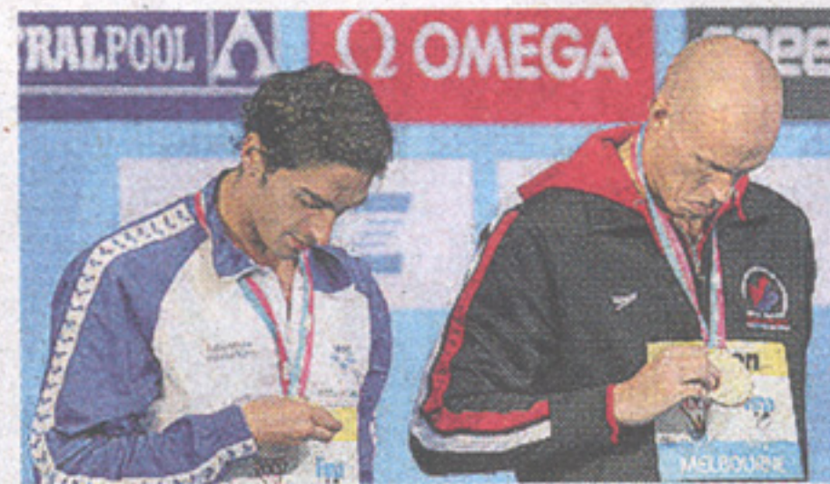
2007 Iridato ex aequo con Hayden

L'intervista Grazie al reality ha staccato dalla delusione di Pechino